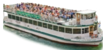
CHICAGO'S FAIR LADY