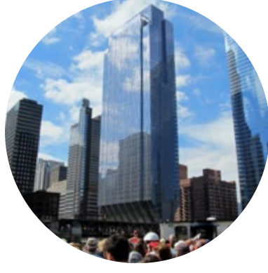
150 NORTH RIVERSIDE