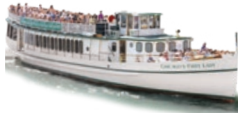
CHICAGO'S FIRST LADY

تتوفر مواقف للسيارات بأسعار مخفضة لمدة تصل إلى أربع ساعات وذلك عبر التحقق من شبكات التذاكر.