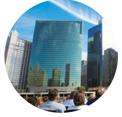
333 WEST WACKER