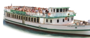
CHICAGO'S LEADING LADY