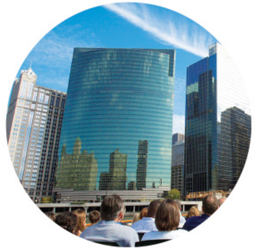
333 WEST WACKER