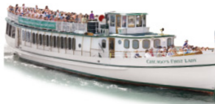
CHICAGO'S FIRST LADY