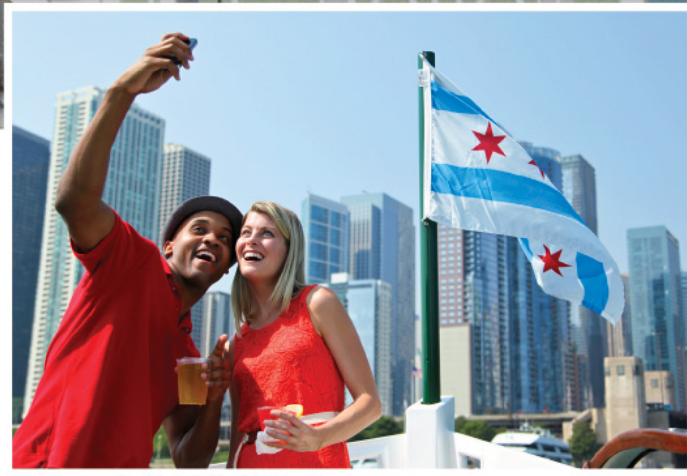
设有吧台恭候您的光临! 整个巡游过程中, 可随意购买饮料、冰茶、啤酒、葡萄酒和鸡尾酒。

马上登录 TicketMaster.com/RiverCruise 或致电 1-800-982-2787 购票