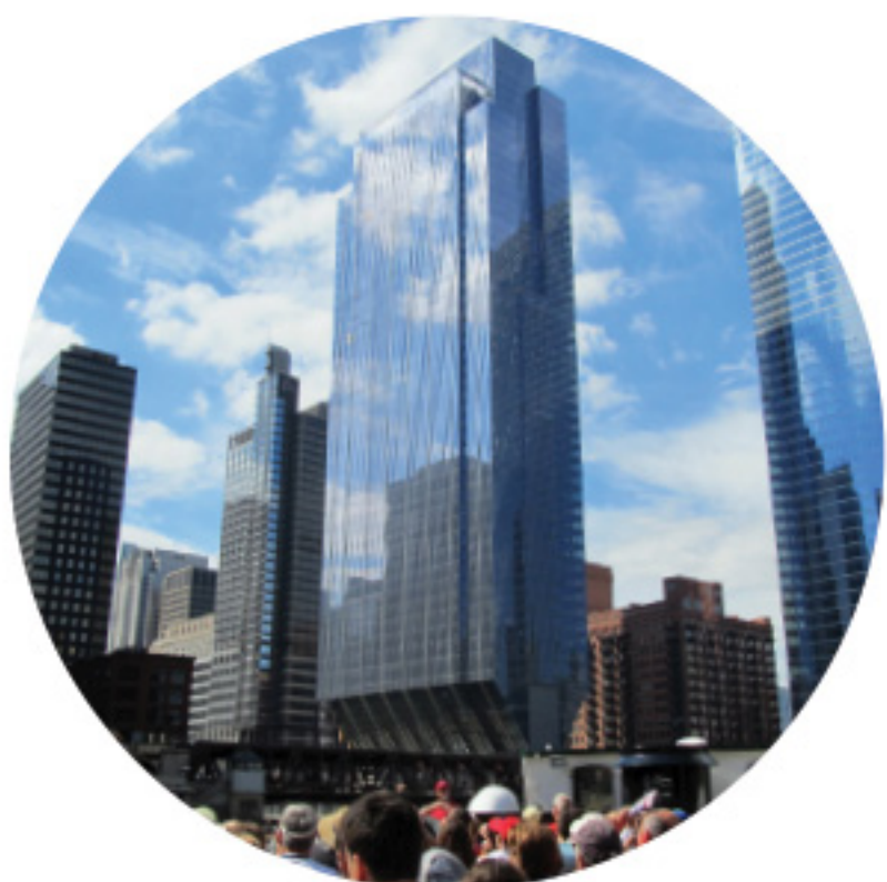
北河滨大道 150 号 (150 NORTH RIVERSIDE)