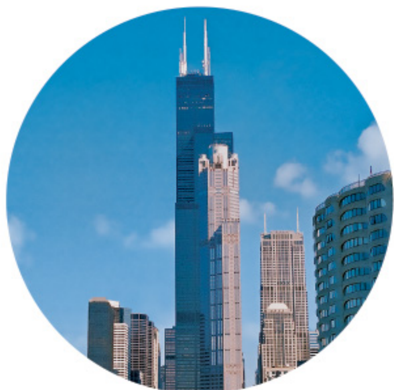
威利斯大厦 (WILLIS TOWER)