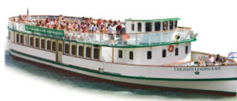
CHICAGO'S LEADING LADY