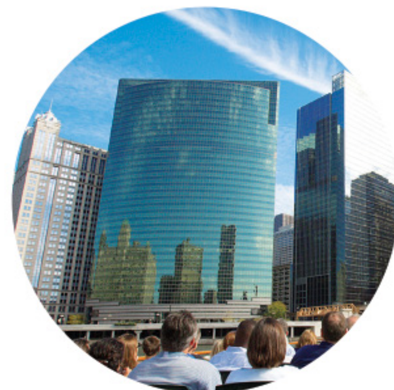
西威克大道 333 号 (333 WEST WACKER)