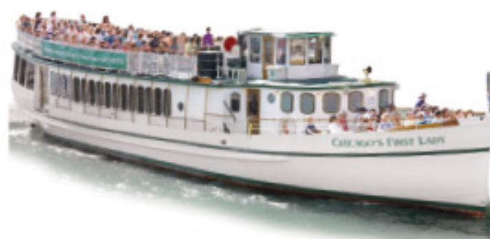
CHICAGO'S FIRST LADY