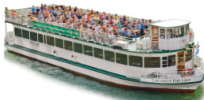
CHICAGO'S FAIR LADY