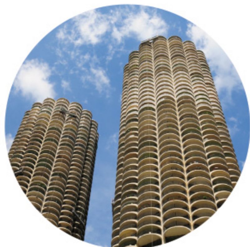
马利纳城 (MARINA CITY)