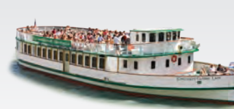
CHICAGO'S CLASSIC LADY