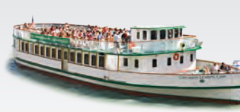
CHICAGO'S LEADING LADY