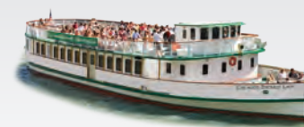
CHICAGO'S EMERALD LADY