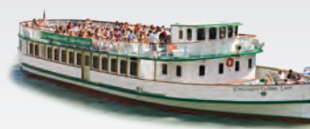
CHICAGO'S CLASSIC LADY