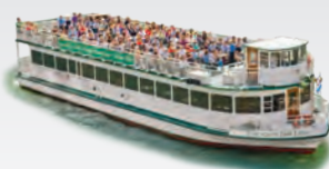
CHICAGO'S FAIR LADY