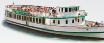
CHICAGO'S LEADING LADY