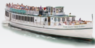
CHICAGO'S FIRST LADY