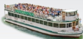
CHICAGOS FAIR LADY