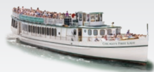
CHICAGOS FIRST LADY