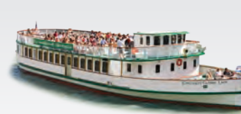
CHICAGO'S CLASSIC LADY