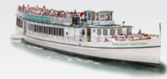
CHICAGO'S FIRST LADY