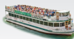
CHICAGO'S FAIR LADY