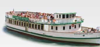
CHICAGO'S CLASSIC LADY